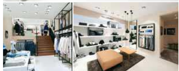
Design: Schwitzke & Partner GmbH