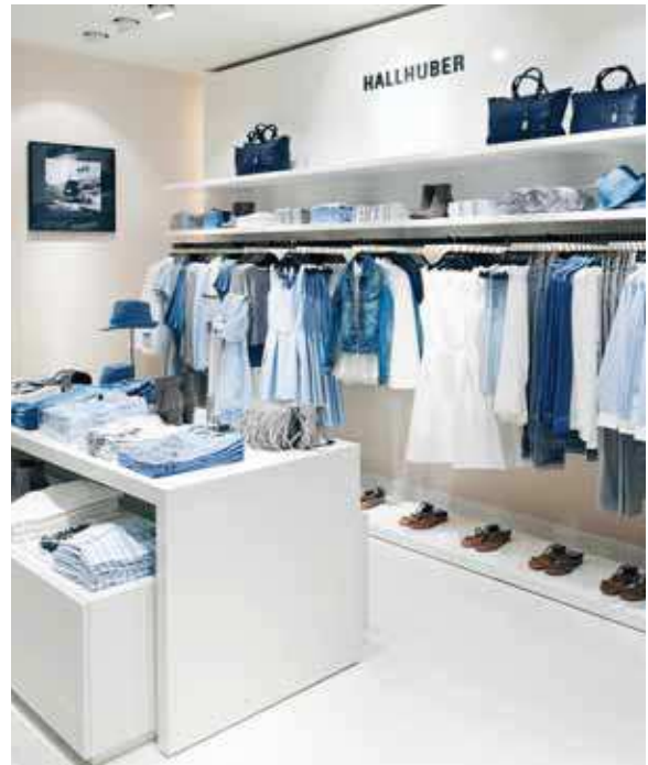
Objekt: HALLHUBER Store München